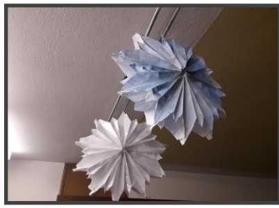
Bastelarbeiten unserer Minis