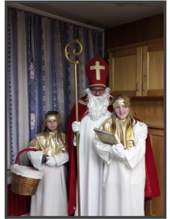
Unsere Nikoläuse mit Engelschar